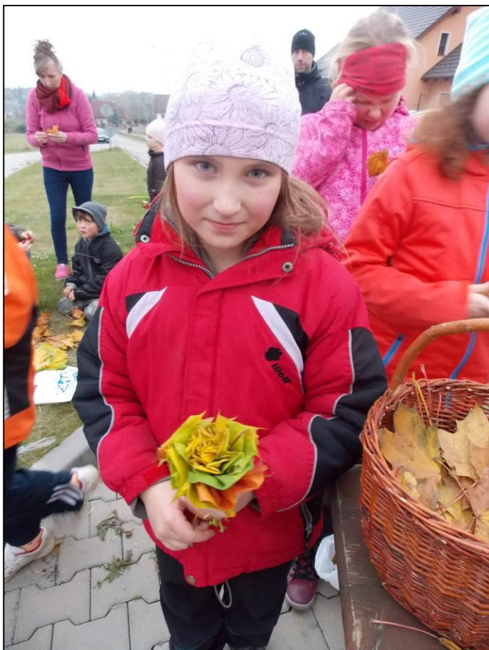
Tvoření z listů