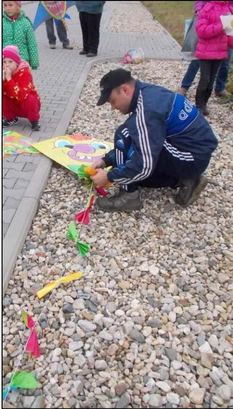
Soutěž o nejoriginálnější doma vyrobenou mašlí